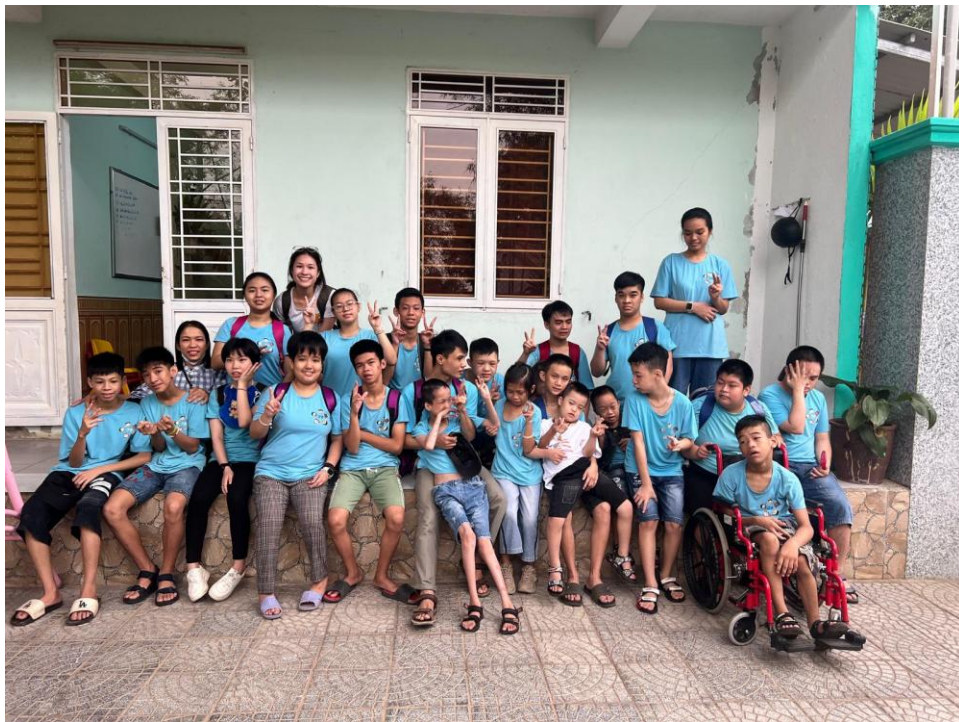
Leerlingen wachten op de bus om op schoolreis te gaan